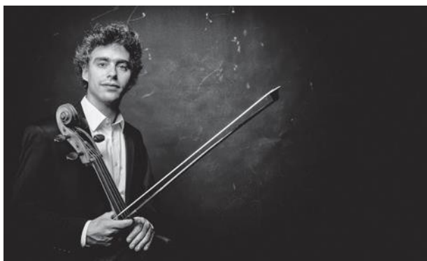
2014 / Pau Codina