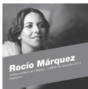
VOLUM 5 Rocío Márquez Flamenco