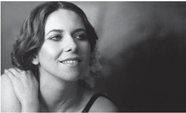
2015 / Rocío Márquez