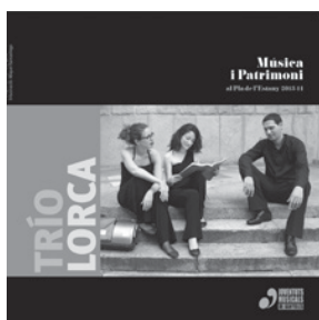
VOLUM 1 Trío Lorca (antic Trío Mozart de Deloitte) Obres de J. Haydn, F. Schubert i L. van Beethoven

Quan l'artista resident és de l'àmbit de la música clàssica, se subscriu un acord entre Catalunya Música i Joventuts Musicals de Banyoles pel qual els enregistraments emesos posteriorment a través d'aquesta emissora especialitzada, i s'inclouen a més en el programa d'intercanvis internacionals de la Unió Europea de Radiodifusió (UER).