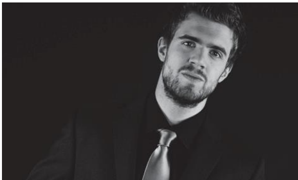
2016 / Josep-Ramon Olivé