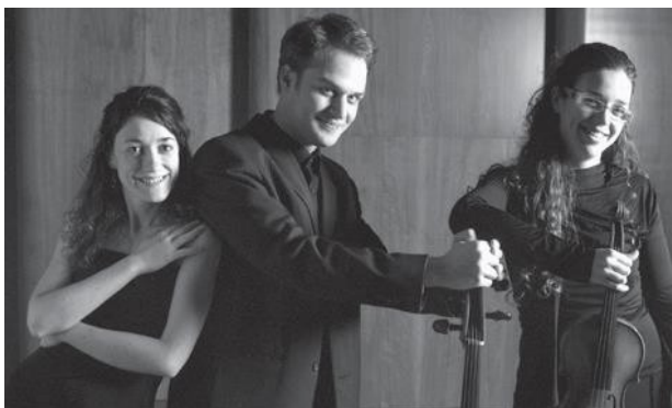
2011 / Trío Mozart de Deloitte