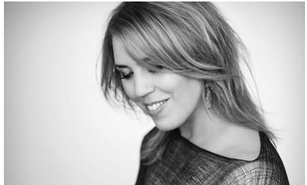
2017 / Gabriela Montero